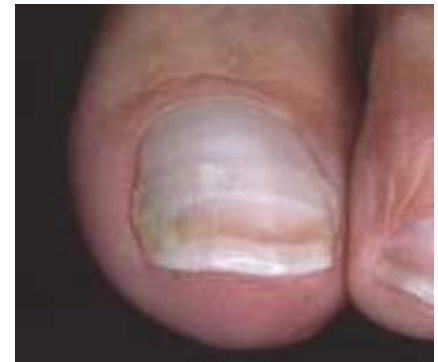
Nach 11 Monaten mit 8 B/S-Spange

Korrekturbehandlung eines stark eingewachsenen Großzehennagels. Nach 11 Monaten mit 8 B/S-Spangen konnte ein hervorragendes Ergebnis erzielt werden - mit sofortiger Schmerzfreiheit seit Beginn der Behandlung.