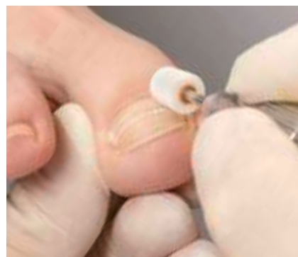
12. Die individuelle Spannungskorrektur

eigenen Rückstellkräfte auf den Nagel. Der Nagel wird sanft, aber sorgsam aus dem seitlichen Nagelfalz herausgehoben. Das physikalische Gesetz von Druck und Gegendruck wirkt dabei in jedem Fall. Denn entweder ist die einwirkende Zugkraft auf Anrieb korrekt – oder sie lässt sich schnell und schonend reduzieren. Dies geschieht durch gezieltes Abschleifen der Spange nach dem Prinzip: Je geringer die Materialstärke, umso geringer ist auch die Zugkraft!