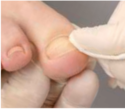
13. Die gewissenhafte Abschlussreinigung