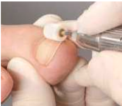
1. Die gründliche Vorbereitung

Wirklich wegweisende Entwicklungen schreiben Erfolgsgeschichte. Die B/S-Spange Classic ist ein ausgezeichnetes Beispiel dafür. Vor mehr als 25 Jahren von Bernd Stolz in Amberg erfunden, hat dieses durchdachte System zur schmerzfreien Korrektur eingewachsener Nägel unzähligen Betroffenen nachhaltig geholfen. Während an der Spange selbst über all die Jahre so gut wie nichts zu optimieren war, sorgt nun der B/S-Aktivator auch bei der Classic-Spange für ein sichereres Aufbringen der Spange auf den Nagel. Grund genug für eine detaillierte Betrachtung dieser sicheren Applikationsmethode.