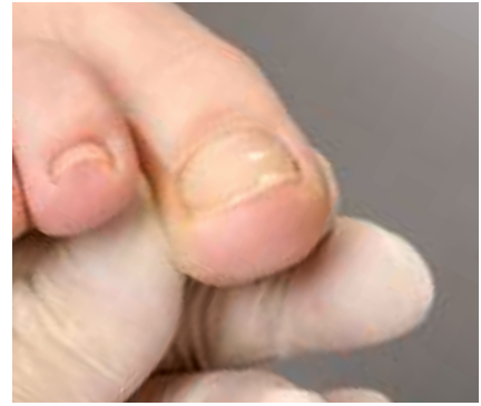
15. Das überzeugende Ergebnis