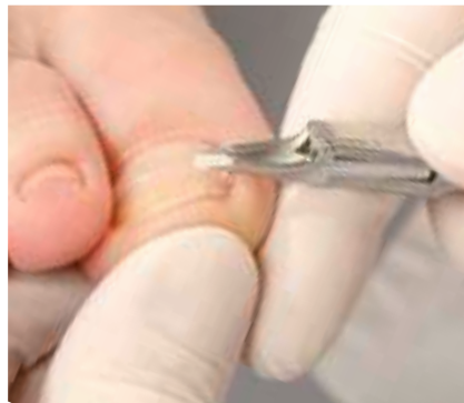
17. Das Entfernen der B/S-Spange: Anlösen der B/S Spange am seitlichen Ende