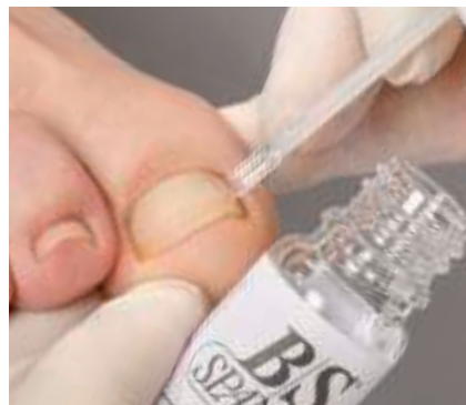
6. Das Auftragen des B/S-Aktivators