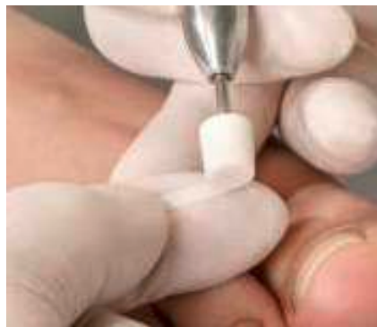
5. Das Zuschleifen der Spangenenenden