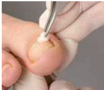
2. Das sorgsame Entfetten