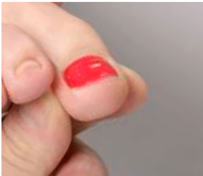
16. Die flankierenden Möglichkeiten: Desinfizieren, Tamponieren, Salbenverbände und Nagellack