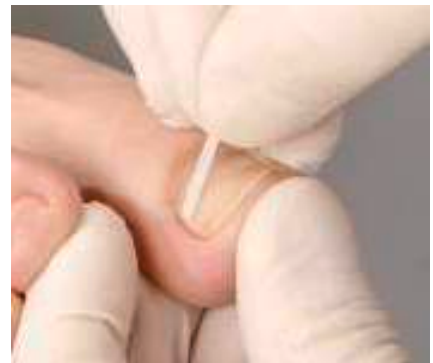
3. Die exakte Anprobe vom Anfang