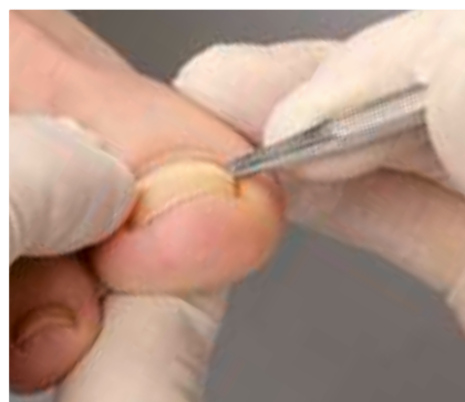
9. Das Andrücken der B/S-Spange rechts