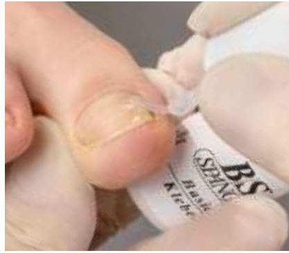
14. Die abschließende Versiegelung