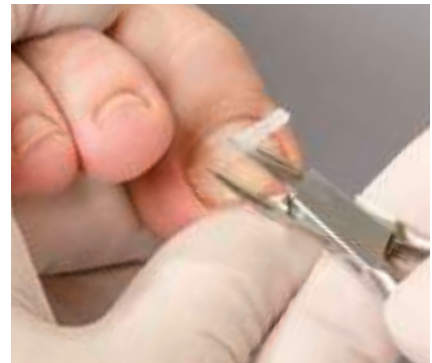
18. Das behutsame Ablösen

dann mit dem B/S-Stahlapplikator – ohne diesen zu verrutschen – über die Breite des Nagels hinweg bis zum gegenüberliegenden Nagelrand an. Ist die Spange zu groß oder zu klein, greifen Sie zur größeren oder kleineren Alternative.