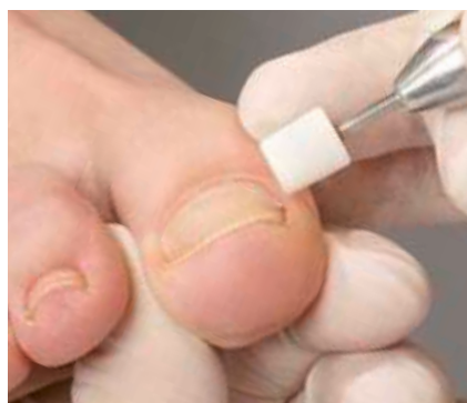
11. Das Angleichen der Spangenübergänge