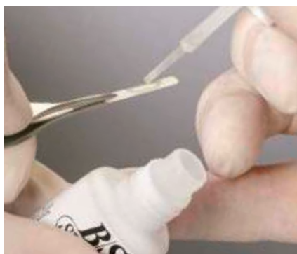
7. Das Auftragen des B/S-Basic-Klebers