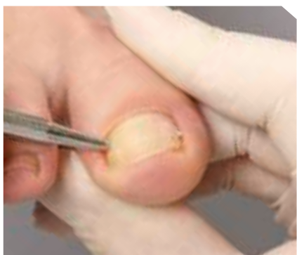
10. Das Andrücken der B/S-Spange links